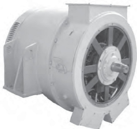
Структура условного обозначения генераторов синхронных типа СГТ-1000