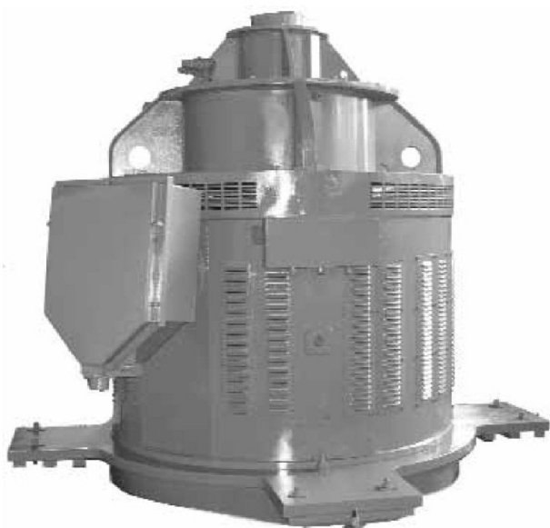
Структура условного обозначения двигателей типа ДВАН