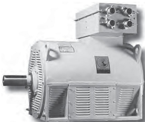
Структура условного обозначения двигателей типа ДАН